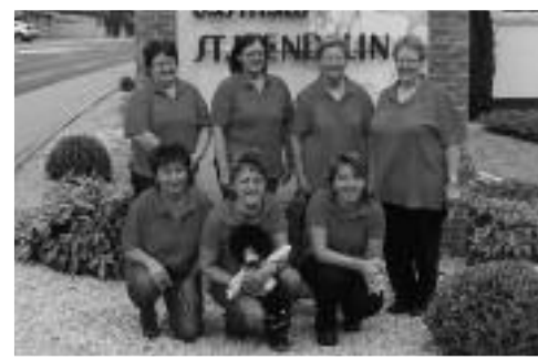
Kat. C, 1. Rang DKK Eintracht-Hüpfen