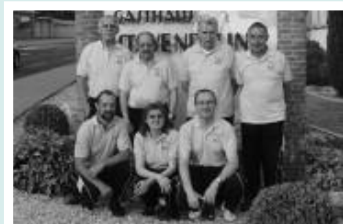
Kat. B, 2. Rang KK Rössli 2