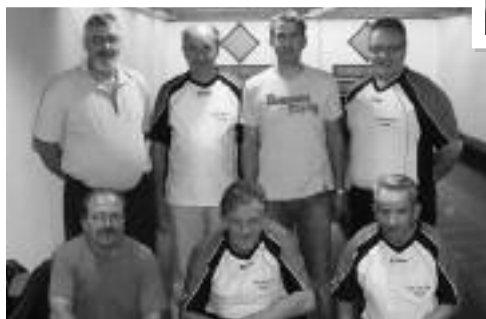
Kat. A, 2. Rang KK Busch