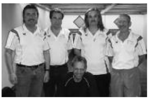
Kat. A, 1. Rang KK 2000