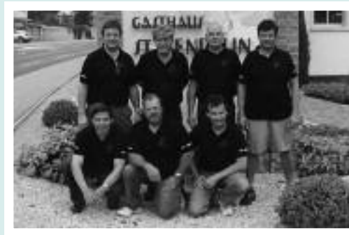
Kat. C, 2. Rang KK Barolo