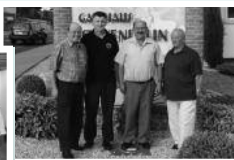
Kat. B, 1. Rang KK Löwen